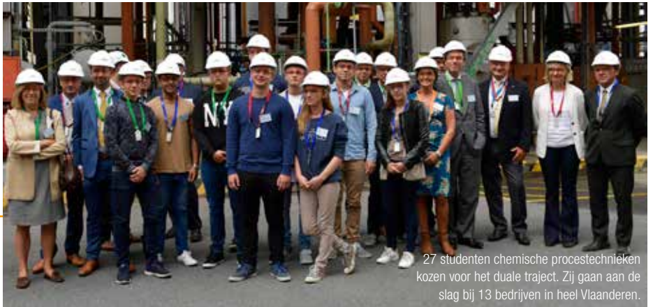
27 studenten chemische procestechnieken kozen voor het duale traject. Zij gaan aan de slag bij 13 bedrijven in heel Vlaanderen.

De leerlingen krijgen het niet op een schoteltje. We verwachten dat ze initiatief nemen.